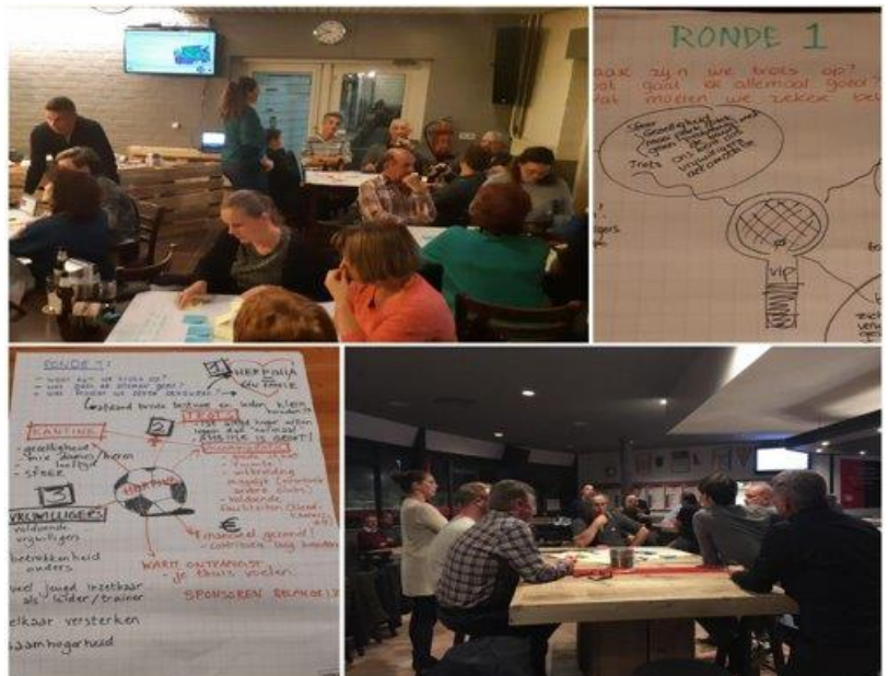
Afbeelding 1 Impressie bijeenkomsten

Het samenbrengen van meerdere sport- en beweegactiviteiten op één locatie biedt kansen om zowel inactieve mensen (bezoekers) als reeds actieve mensen meer te laten bewegen. Doordat zij in aanraking komen met andere of nieuwe activiteiten zal de drempel minder hoog zijn om hierin te participeren. Uit de bijeenkomsten bleek bijvoorbeeld dat veel voetballers nog nooit op de huidige tennislocatie zijn geweest en daarom geen beeld hebben van deze vereniging. Ook de activiteiten van Dunes Games waren bij veel Herpenaren nog onbekend. De benaderde personen gaven aan hier meer open voor te staan als deze activiteiten op één centrale plek worden aangeboden. Een impressie van deze bijeenkomsten is te zien in afbeelding 1.