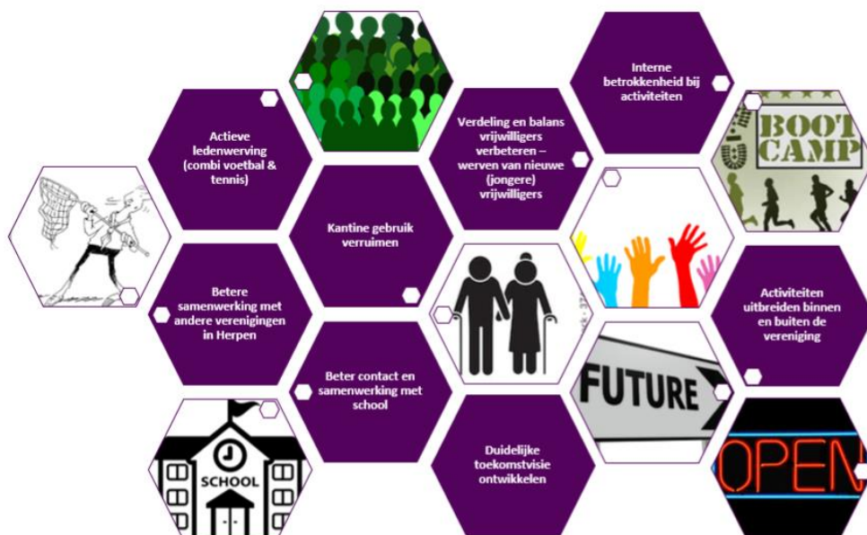
Figuur 3 Kansen van een vitale vereniging