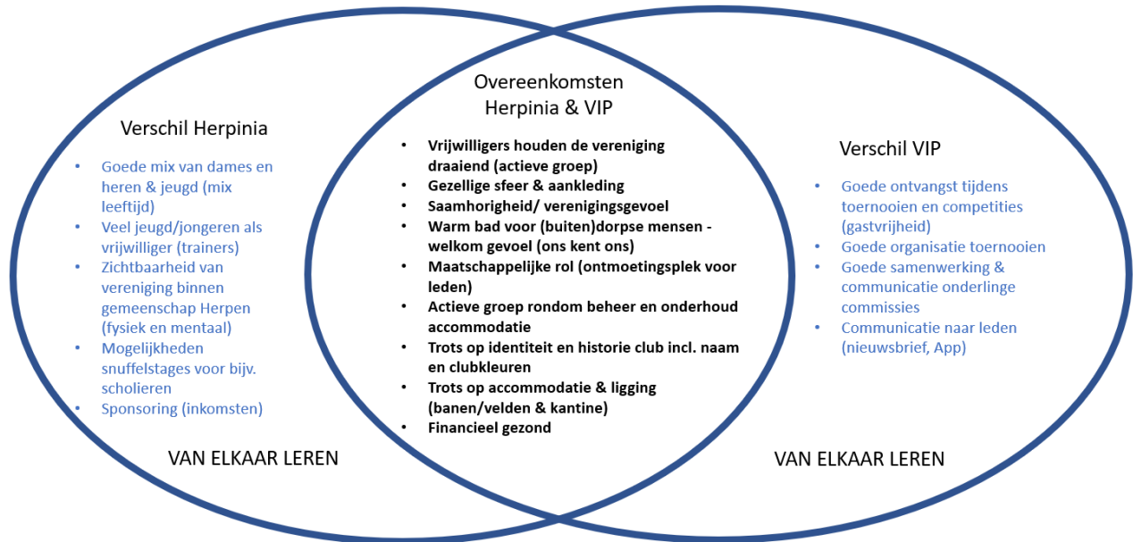
Figuur 1 Sterke punten VIP en Herpinia

In oktober 2019 hebben tennisvereniging VIP en voetbalvereniging Herpinia in samenwerking met het Sport Expertise Centrum brainstormavonden georganiseerd voor leden, buurtbewoners, overige verenigingen en andere geïnteresseerden. Hierdoor zijn de verenigingen tot nieuwe inzichten gekomen, die aangaven op welke gebieden Herpinia en VIP overeenkomsten delen, verschillen hebben, van elkaar kunnen leren en wat zij samen kunnen verbeteren. Dit is terug te vinden in figuur 1 en 2.